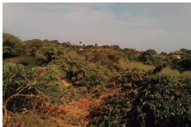
Figura 4. Agroecosistema de la Finca San Ignacio, donde se halló el cráneo del ejemplar de D. punctata , indicando la presencia de cultivos de yuca ( Manihot esculenta ) (esquina inferior izquierda), café ( Coffea arabica ) (esquina inferior derecha), y guaduales ( Guadua angustifolia ) (esquina superior izquierda).

de yuca ( Manihot esculenta ). El cultivo de yuca es una de las fuentes económicas principales de la finca San Ignacio y la presencia de guatines en el área ha generado históricamente conflicto, porque estos animales destruyen los cultivos. La finca San Ignacio, se encuentra en el límite entre los municipios de Quimbaya y Filandia, en un agroecosistema donde el cultivo de la yuca se alterna con plantaciones de plátano ( Musa paradisiaca ), café ( Coffea arabica ), y presencia de guaduales ( Guadua angustifolia ), usualmente asociados a cursos de agua (Figura 4).