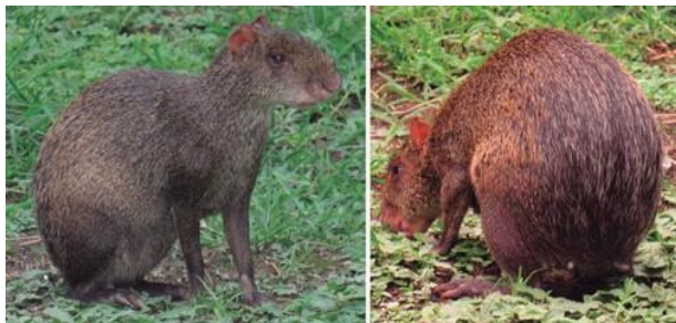
Figura 1. Ejemplares de Dasyprocta punctata fotografiados en la ciudad de Armenia, Quindío.

El guatín D. punctata , posee una cola rudimentaria y un pelaje cerdoso de color pardo rojizo y no posee líneas (Patton et al. 2015). La especie se caracteriza por presentar la cabeza, el dorso y la rabadilla de color marrón rojizo uniforme o negruzca con pelos amarillentos; tiene además la parte media del cuerpo y su porción posterior de color negro, pelos pálidos sobresaliendo en la rabadilla y extremidades de color marrón o negruzco (Patton et al. 2015) (Figura 1).